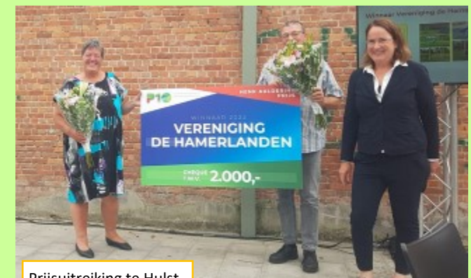
Prijsuitreiking te Hulst

Het initiatief is niet alleen duurzaam omdat het zich richt op het bestrijden van de biodiversiteitscrisis, maar ook in sociaal opzicht omdat het de hele gemeenschap mobiliseert waarbij zowel jong als oud betrokken zijn.