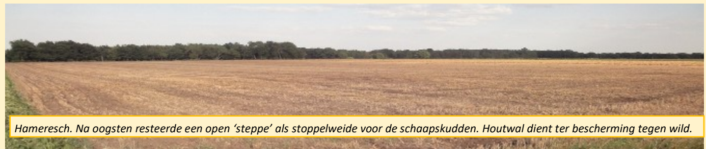
Hameresch. Na oogsten resteerde een open 'steppe' als stoppelweide voor de schaapskudden. Houtwal dient ter bescherming tegen wild.

Wat resteert zijn straatnamen als: Waardeellaan, Markescheiding, Es; en dat laatste dus niet als boom.