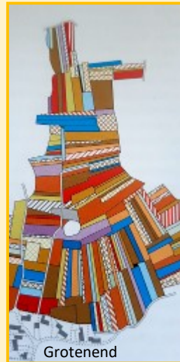
Bezitsverdeling Hameresch/Oosteresch rond 1640. Uit Theo Spek, Het Drentse Esdorpenlandschap.

den leverde te weinig mest op. De boeren vulden dit tekort aan door het houden van schapen op de heidevelden. De schapen verbleven 's nachts in potstallen, waar ze hun mest deponeerden. Dat brachten de boeren in plaggen op de es-akkers.