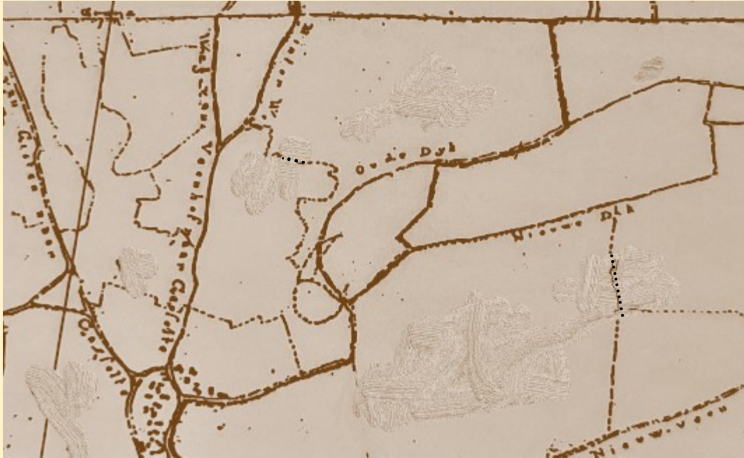
Kaart 1. Landmeterkaart 1811—1813 (detail uit origineel rechts)