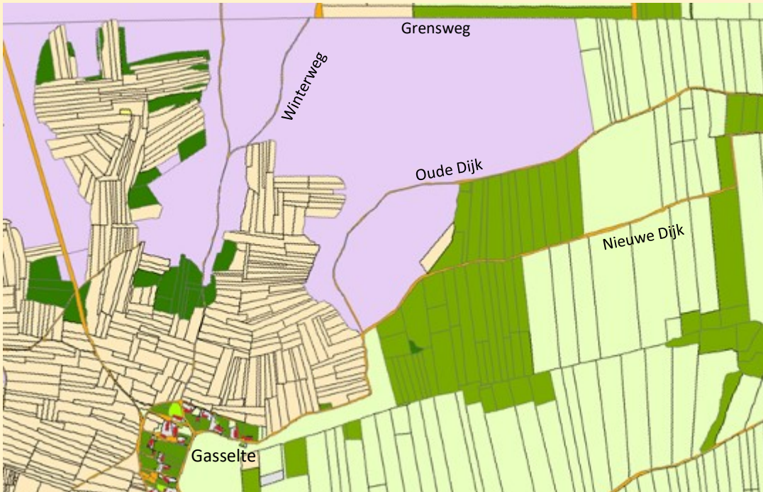
Kaart 2. Kadasterkaart 1832