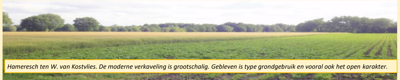
Hameresch ten W. van Kostvlies. De moderne verkaveling is grootschalig. Gebleven is type grondgebruik en vooral ook het open karakter.

Hoe houd je de es vruchtbaar? De veeteelt op de groengron-