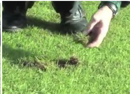
Oprapen en terug leggen