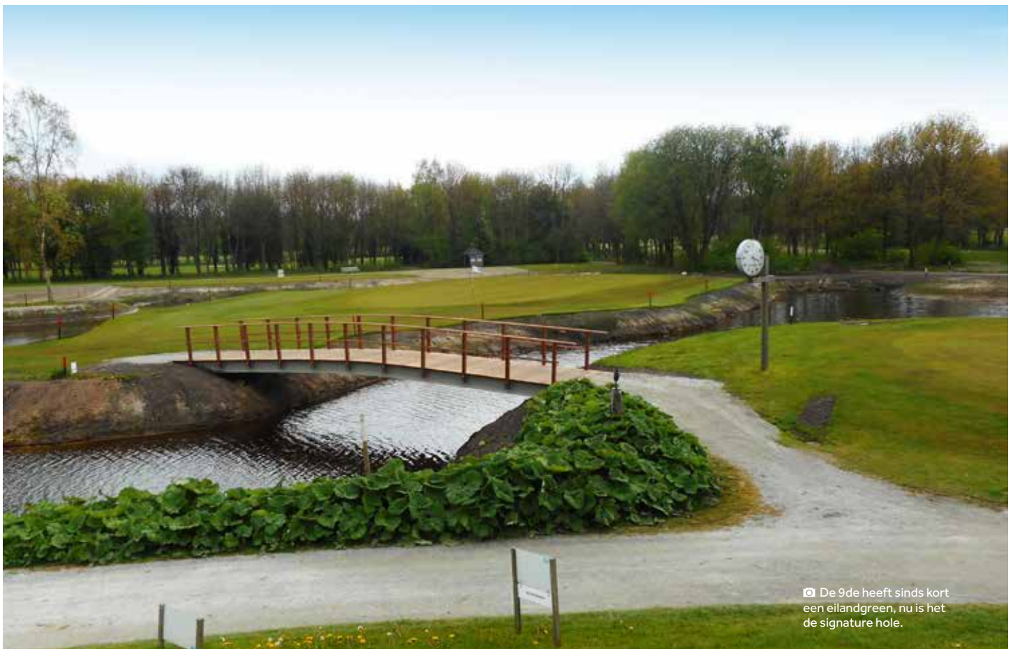
De 9de heeft sinds kort een eilandgreen, nu is het de signature hole.

We zijn met zo'n veertig leden gegroeid en dat is uitzonderlijk in deze tijd