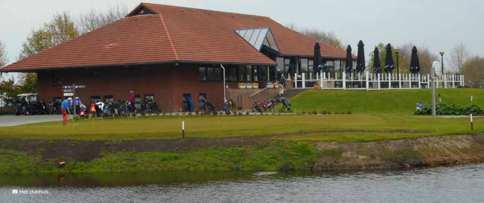
📷 Het clubhuis

IN HET NOORDOOSTEN VAN NEDERLAND IS DE CONCURRENTIE GROOT. ER ZIJN VRIJ VEEL BANEN TERWIJL ER MINDER GOLFFERS WONEN DAN IN DE RANDSTAD. MAAR DE DRENTSE GOLFCLUB DE SEMSLANDEN IS NA EEN AANTAL VERANDERINGEN EEN GEZONDE VERENIGING.