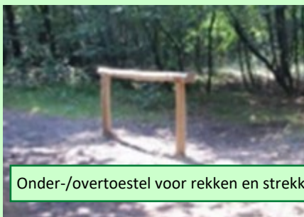
Onder-/overttoestel voor rekken en strekken